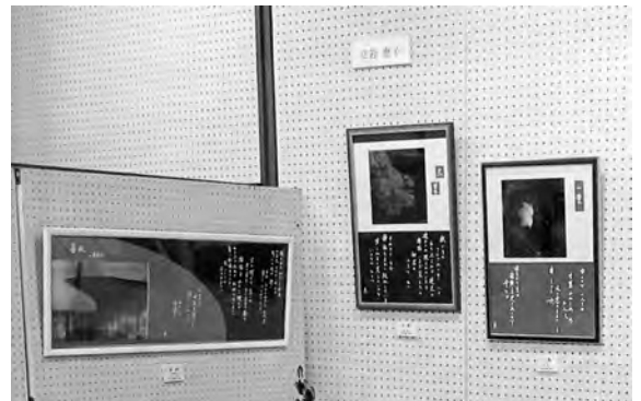
昨年の詩画展から