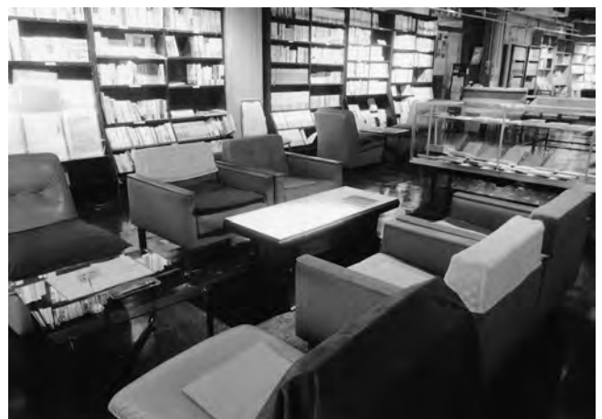
第一展示室のソファのコーナー ゆっくり読書ができます